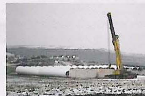
Martifer Renewables - Parques Eólicos, Roménia