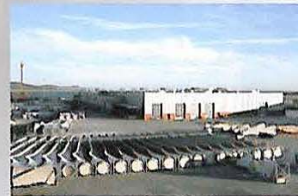
Enercon - Componentes Eólicos, Viana do Castelo