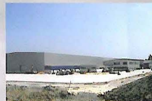
Repower - Rotor Blade Factory, Vagos